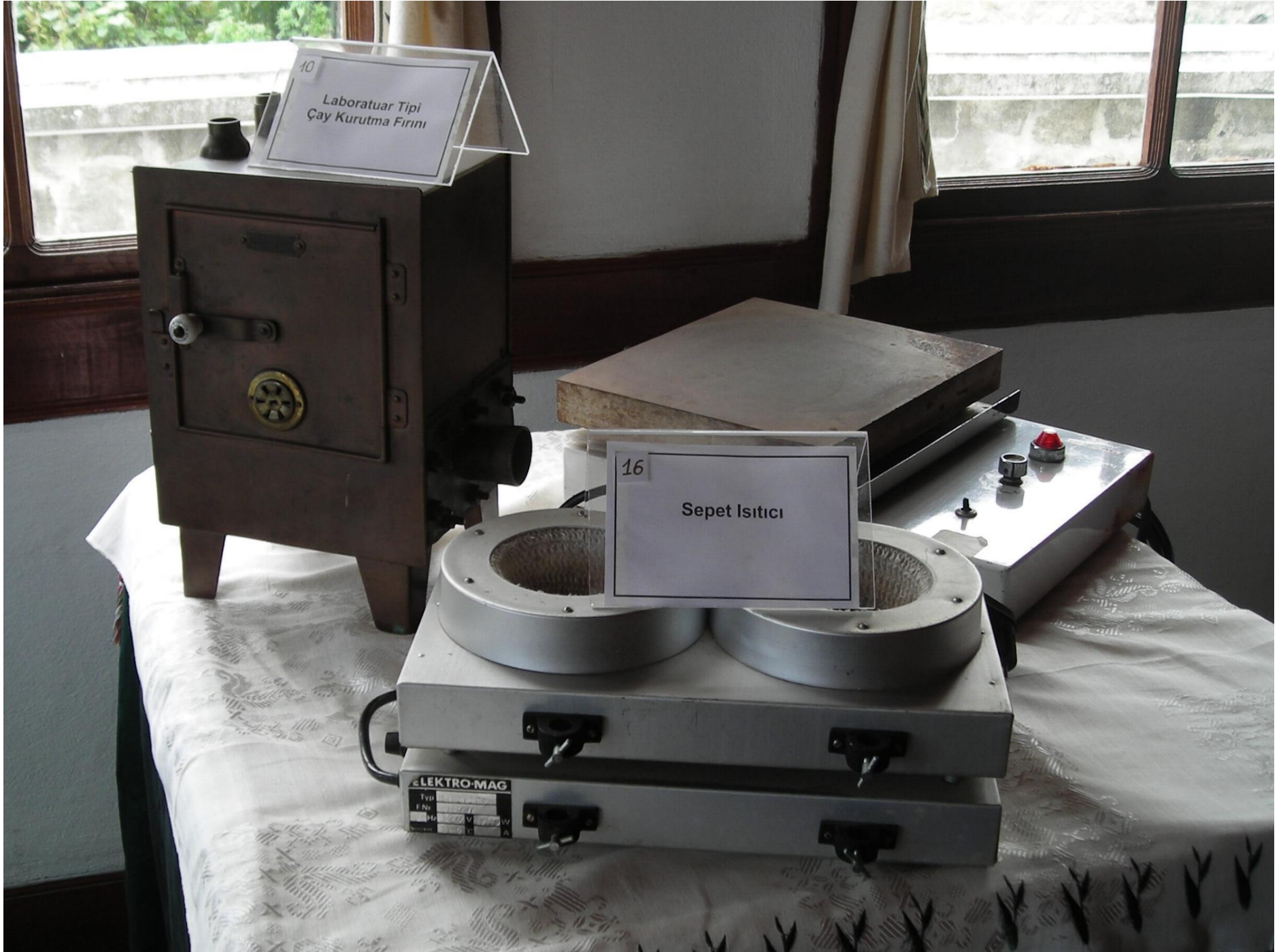
10 Laboratuar Tipi ay Kurutma Fırını