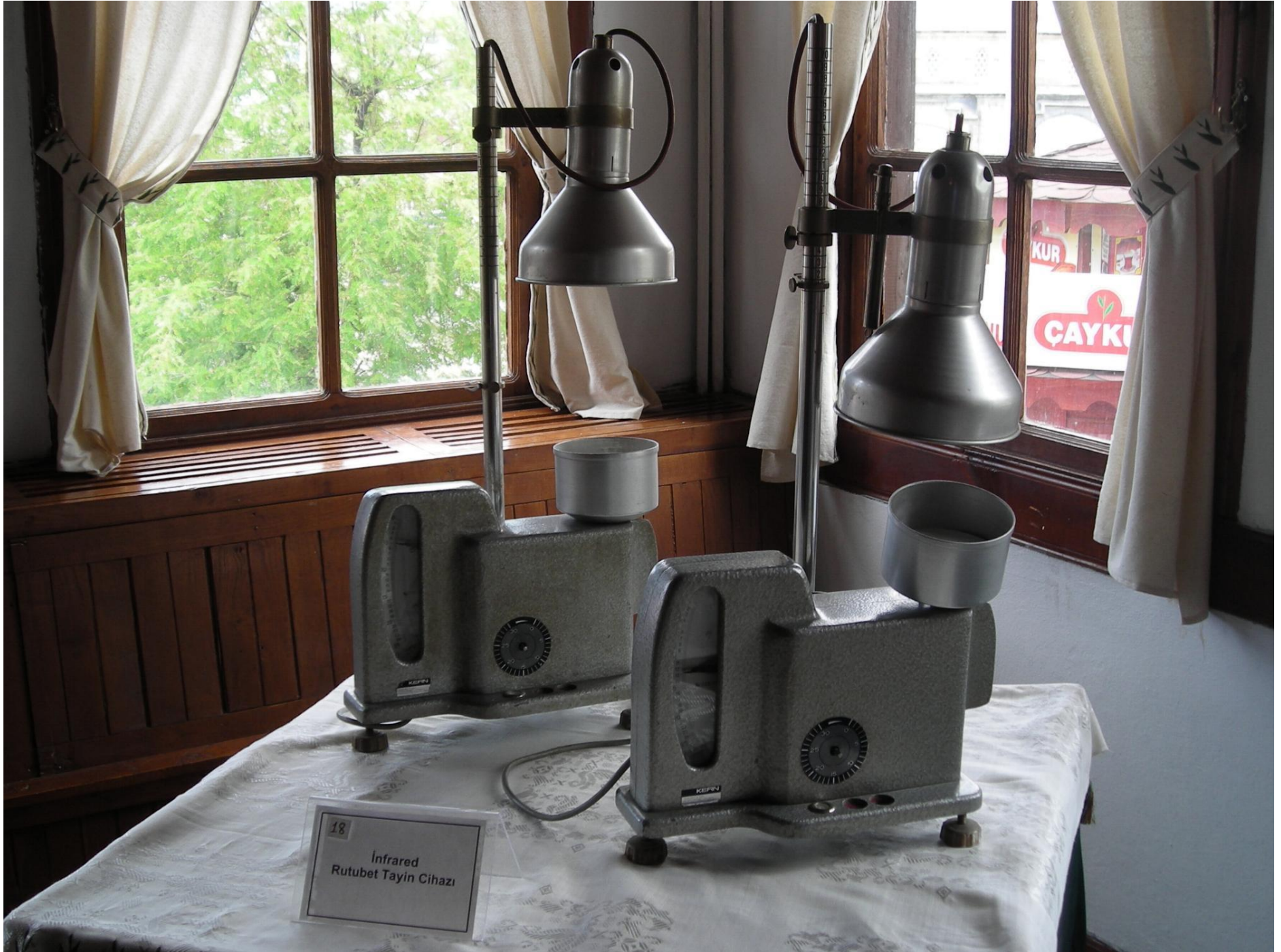
18 Infrared Rutubet Tayin Cihazı