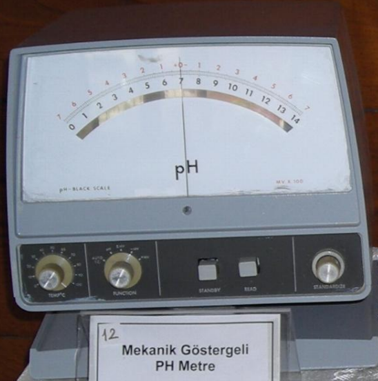
12 Mekanik Göstergeli PH Metre 1960-1985 Yılları arasında kullanılmıştır.