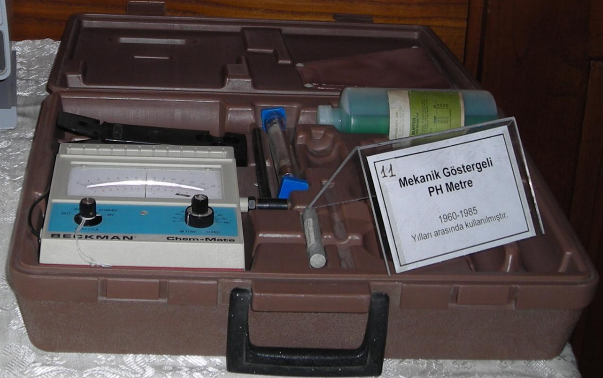
11 Mekanik Göstergeli PH Metre 1960-1985 Yılları arasında kullanılmıştır.