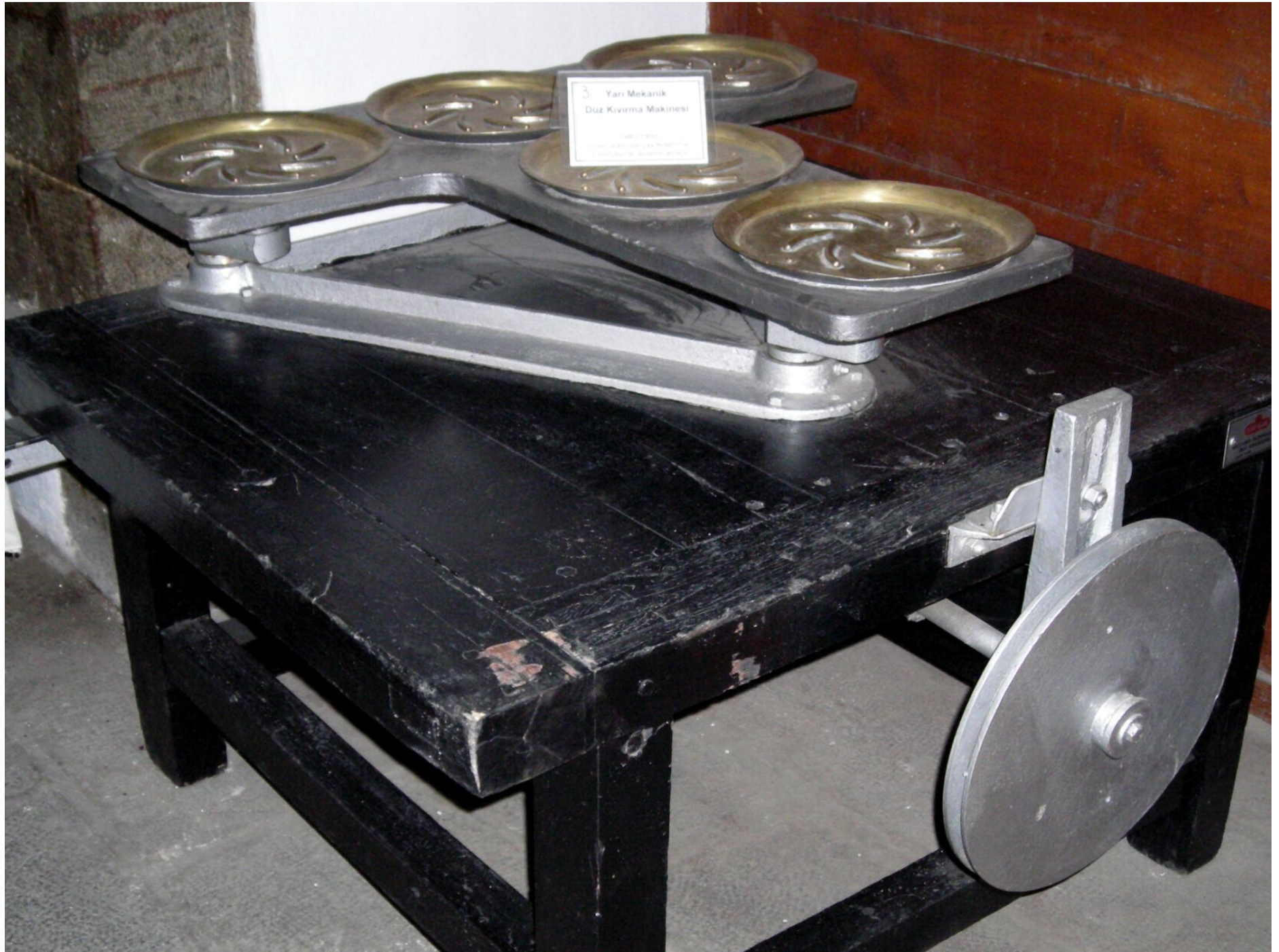
3 Yarı Mekanik Duz Kivirma Makinesi