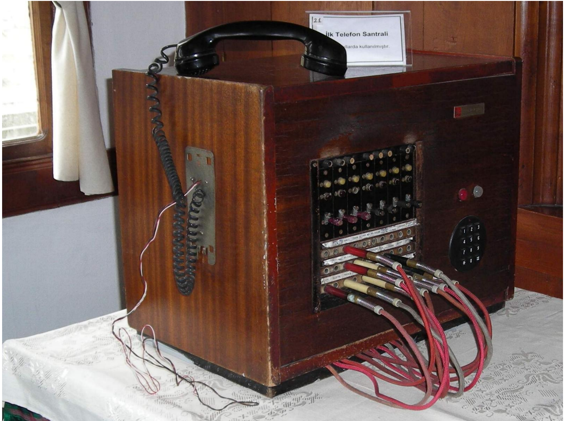
21 İlk Telefon Santrali ...larda kullanılmıştır.