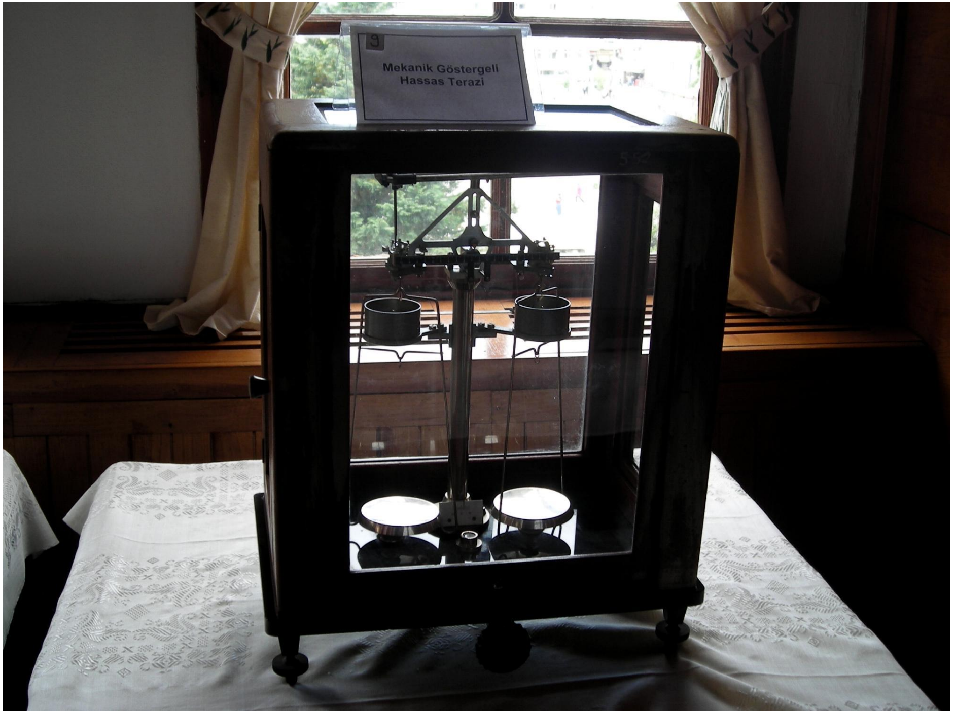
9 Mekanik Göstergeli Hassas Terazi